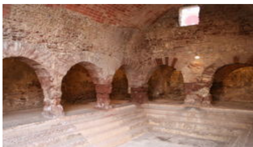
Termes romanes de Caldes de Montbui

L'indret escollit no us desagradarà pas. Caldes de Montbui (Vallès Oriental) és un municipi d'uns 16.000 habitants, disseminats entre el nucli urbà i diverses urbanitzacions, alguna de les quals s'emplaça a una altura d'uns 800 m. El terme municipal té una extensió de 38 km 2 i està situat a 35 km. al nord de Barcelona. Les aigües termals, que surten de la terra a uns 74° C, han determinat la seva vida i el seu propi nom. En la crònica de la Hispania Romana, l'escriptor Plini ja parlava de termes romanes i del balneari. Caldes és avui un centre turístic, cultural, comercial, esportiu i natural. Més d'un milió de litres per dia d'un aigua que conté clor, fluor, bromo i iode, i que és utilitzada per combatre l'artritis, fractures, etc.