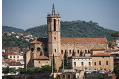
Església de Santa Maria

L'itinerari per la vila ens ofereix antigues termes romanes, la Font del Lleó, els llavadors d'aigua termal, els balnearis, el museu Thermalia i la casa-museu dels Delger, el pont romànic i l'ermita del Remei, el museu Hugué amb obres d'Hugué i de Picasso. Acabat l'itinerari us podeu reconfortar amb els típics carquinyolis, el licor Les Flors del Remei i la llonganissa.